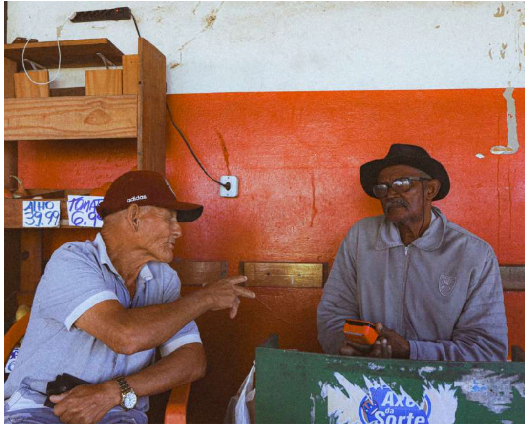
PARQUE ECOLÓGICO PORTO SEGURO. 2025.

Para mim, é impossível não lembrar do meu avô e do meu pai, que, vira e mexe, faziam suas apostas, quando o tempo parecia correr em outro compasso e o mundo se resumia a resenha, risos leves, cheiro de feira e bilhetes amassados.